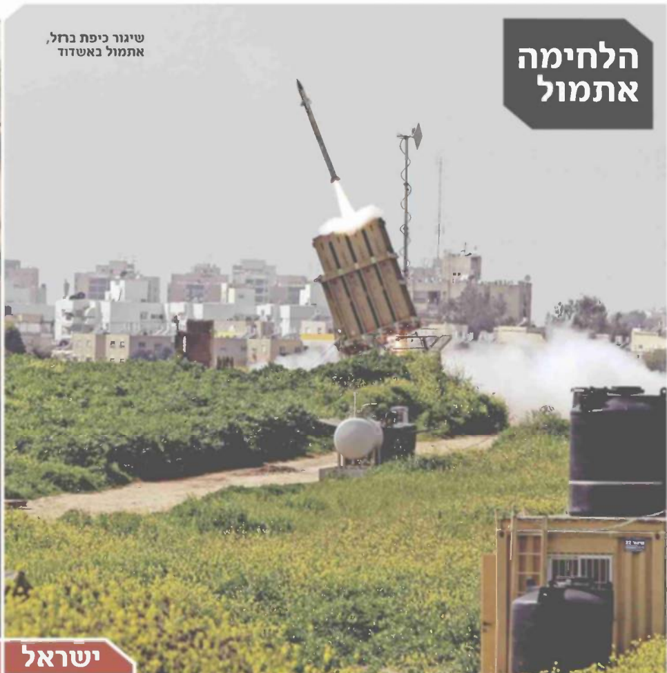
שיגור כיפת ברזל, אתמול באשדוד