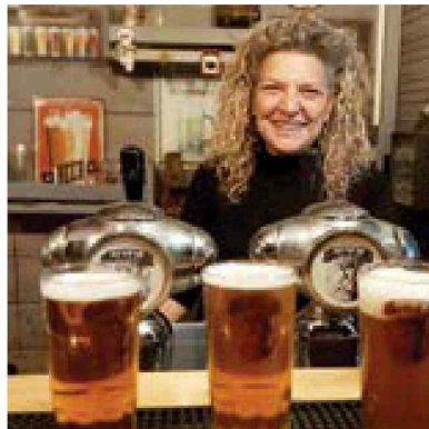
סיפורים על בירה. קרמזינה, תלמי יפה