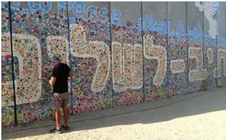
פסיפס לשלום. החומה בנתב העשרה