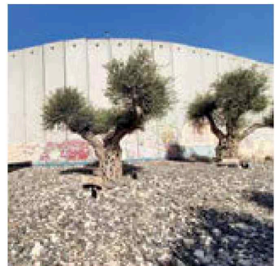
ק העשרים לזכרם של הנופלים ממושב נתיב העשרה