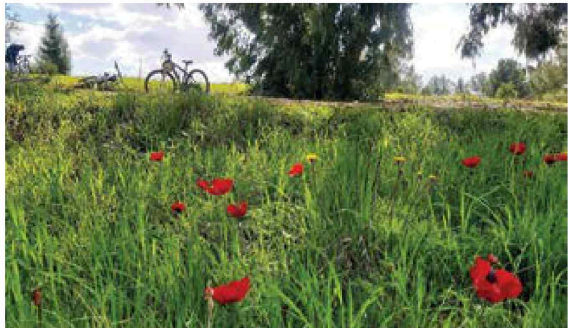
בעקבות הכלניות. דרך נוף נחל שקמה

דרך הנוף המלווה את נחל שקמה נמתחת לאורך 60 ק"מ שמתחילים בשמורת פורה (סמוך לכביש 40) ומסתיימים בשפך הנחל לחוף זיקים. דרך העפר הלבנה עבירה לכל כלי הרכב והיא מחברת בין טבע לאתרי ארכאולוגיה ומורשת ומאפשרת עצירות מעניינות בשמורת כרמיה, במאגר שקמה, בחרבת חרב, במגדל האש ובחרבת ג'ממה. המסלול משולט ומסומן בכחול ועובר בין שדות, יערות, בוסתנים, עצי שקמה גדולים ומצלים, נביעות מים, וגם דיונות שמזמינות לטפס עליהן, לתצפת על האזור ולרדת למטה בגלגול על החול הרך (אפשר להתחיל את המסלול גם הפוך, מזיקים והלאה). על הדרך נהנים כמובן מהפריחה הפוטוגנית והיפהיפה של הכלניות הצובעות את המרחבים באדום. eyarok.org.il