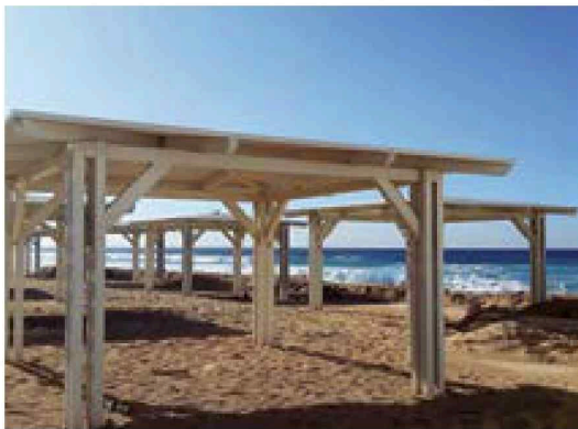
פרגולות לבנות מול ים כחול. חוף זיקים המתחדש