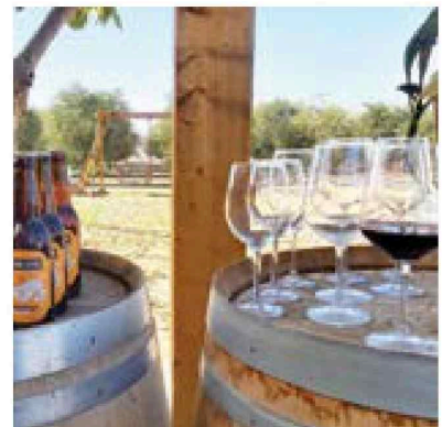
יין מקומי ובירה טובה מול נוף יפה. יקב משק שטרן