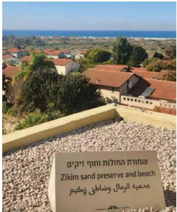
תצפית נוף מהגג של בית עלמי על הקיבוץ ועד חוף זיקים