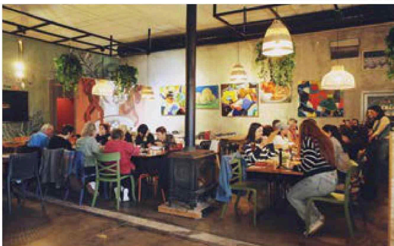
אתנחתא קוליברית בסגנון איטלקי. מסעדת קראווג'ו