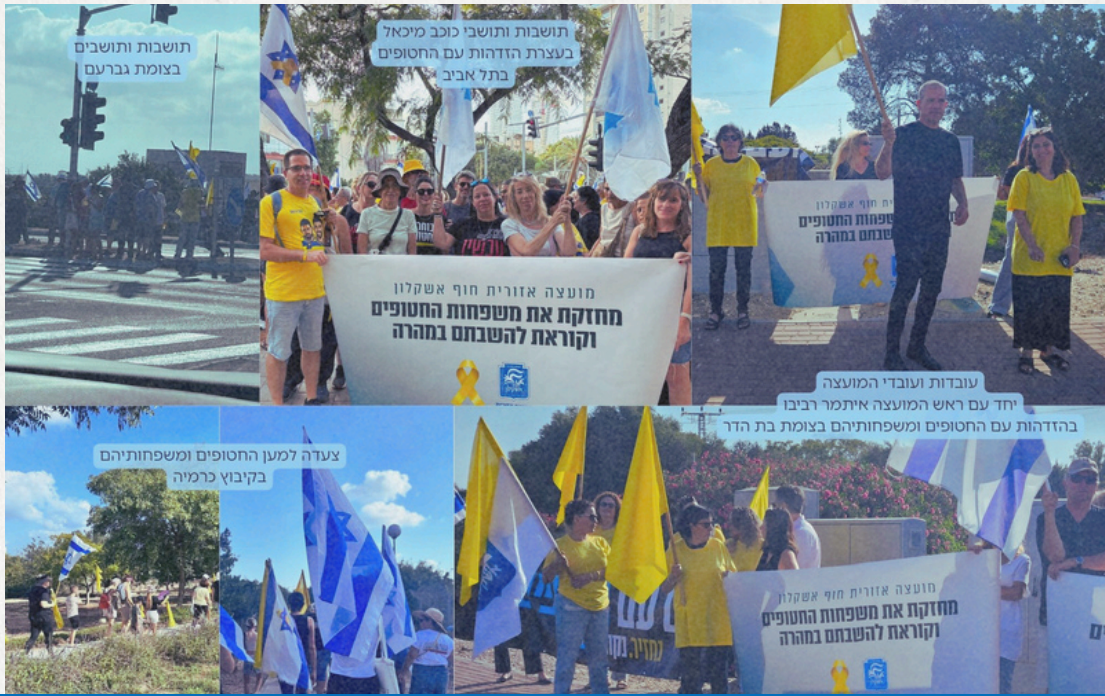
תושבות ותושבים בצומת גברעם