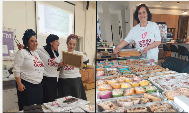
יום המעשים הטובים בחוף אשקלון

מופע חדש, ומיואש במיוחד, כי הכל קשוח, קשה ובעיקר כי הכל מטומטם