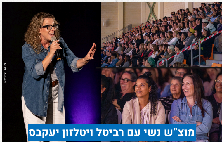
מוצ"ש נשי עם רביטל ויטלזון יעקבס

לרגל יום האישה החל בחודש מרץ, מאות מנשות חוף אשקלון הגיעו להופעה של האושייה רביטל ויטלזון יעקבס, עם המופע "הכל מטומטם" שהתקיים במוצ"ש האחרון בבאר גנים.