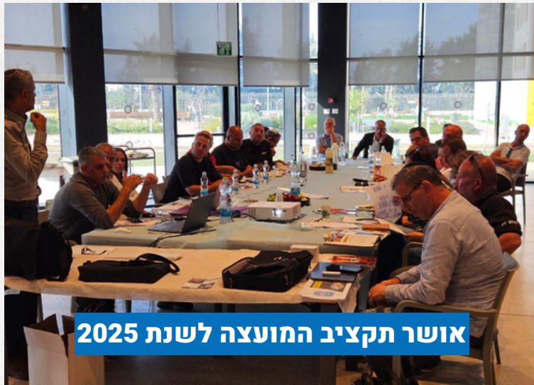
אושר תקציב המועצה לשנת 2025

השבוע נערכה ישיבת אישור תקציב לשנת 2025 של המועצה האזורית.