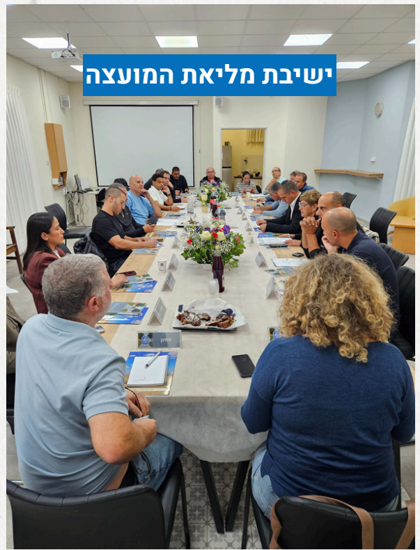
ישיבת מליאת המועצה

תודה לכם על לילות כימים, בהגנה ובשמירה על הסדר והביטחון!