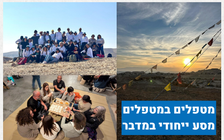
מטפלים במטפלים מסע ייחודי במדבר

לאחר חודשים רבים של עבודה מאומצת, יצאו השבוע 38 מטפלות ומטפלי חוסן, למסע בן 3 ימים של למידה והתחזקות במדבר. במהלך המסע עברו המטפלים תהליך משמעותי של למידה והתבוננות, דרך המדבר ועוצמותיו, הצליחו לנח ולפתח את משאבי החוסן הקיימים בתוכם, וכל זה למענם של תושבי ותושבות חוף אשקלון.