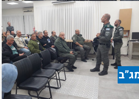
ערב הוקרה למתנדבי מתמי"ד מג"ב