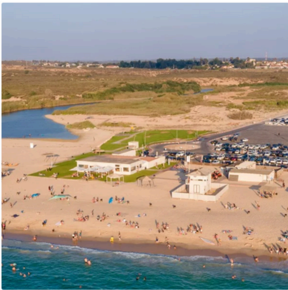
חוף זיקים לפני השבעה באוקטובר. אוגוסט 2023.