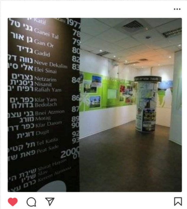
הקמת מרכז קטיף ביישוב ניצן. 2006.